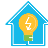
Réduction des consommations d'électricité