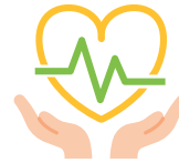
Santé & bien-être au travail