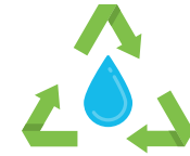
Réduction des consommations d'eau