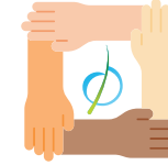
Diversité & mixité sociale