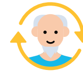
Emplois des seniors