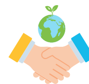
Ethique des affaires