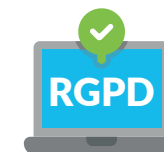
Mise en conformité RGPD