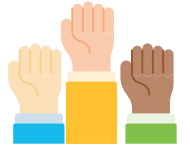
Lutte contre les discriminations