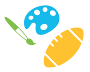
Engagement culturel & sportif