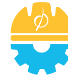
Sécurité au travail