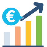
Prime à la productivité