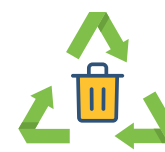
Gestion des déchets