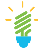
Utilisation d'éclairage LED