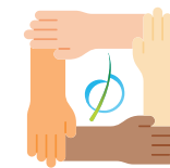
Diversité & mixité sociale